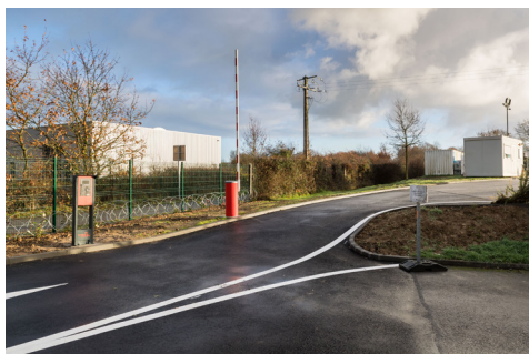
Amélioration de l'accès à la déchèterie de Cordemais