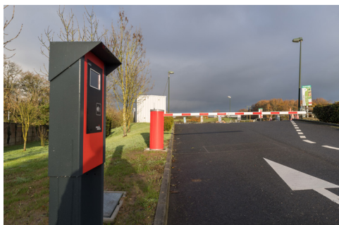
Installation des barrières de contrôle d'accès aux entrées (Exemple à Saint Étienne de Montluc)