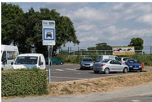
Aire de co-voiturage - Savenay

Le territoire bénéficie également d'une offre de transport en commun routier (scolaire et interurbain) qui offre un service de qualité et accessible à tous.